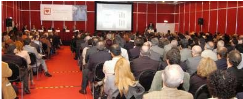
2008 年度世界心脏病学大会的其中一场会议