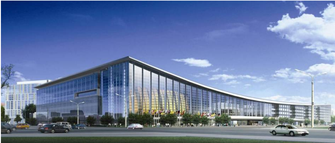
2010 年度世界心脏病学大会学术会议的会址——中国国家会议中心（CNCC）

如果您想了解WCC 2010 学术会议的更多信息，或者您有意马上注册，请访问 大会网站 。